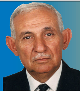
إعداد: عبد الرحيم ابن جلون