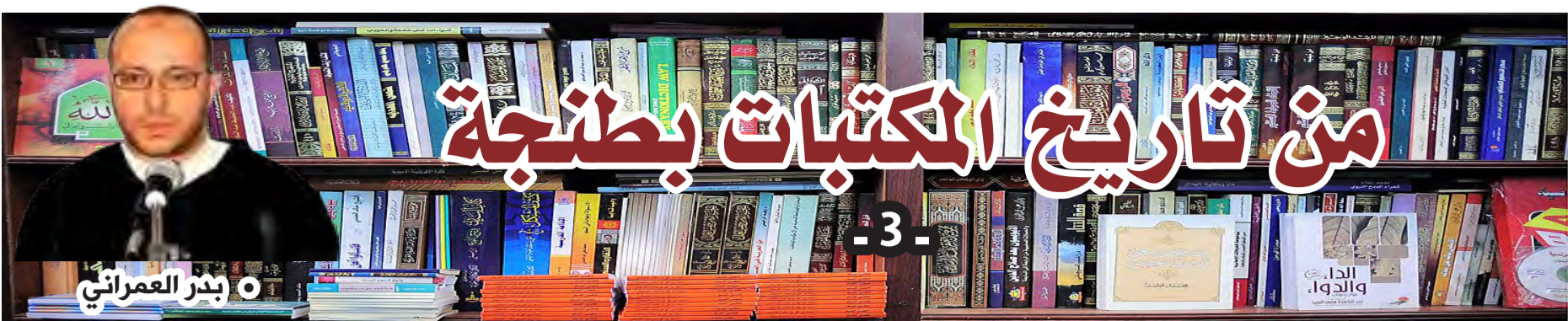
• بدر العمراني