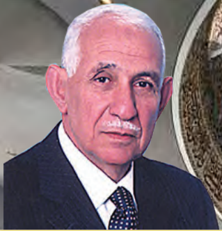
إعداد : عبد الرحيم ابن جلون