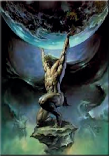
أطلس وهو يحمل القبة السماوية

وحسب الأسطورة، أن «أطلس» علق الأسطورة الإغريقية، كان محكوما عليه من طرف «زيوس» كبير الآلهة، بأن يحمل فوق كتفيه القبة السماوية، ولما مات بقيت الجبال الممتدة من أقصى الشمال إلى أقصى الجنوب المغربي تحمل اسمه: - «جبال الأطلس» ..