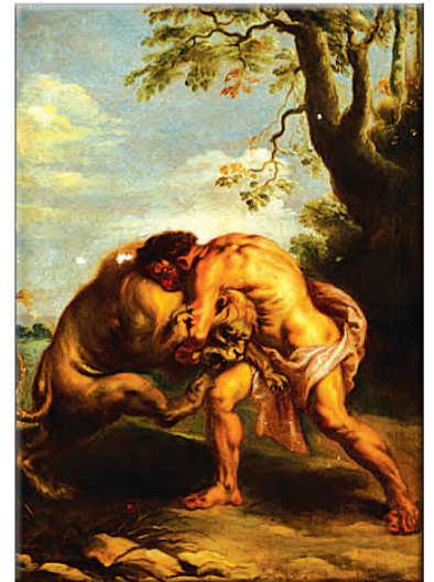
هرقل يخنق الأسد النيمي