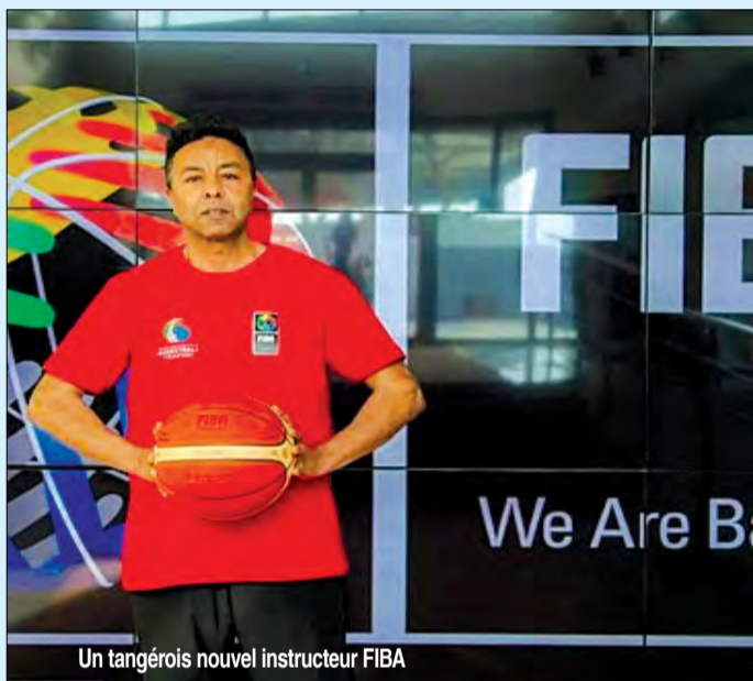
Un tangerois nouvel instructeur FIBA