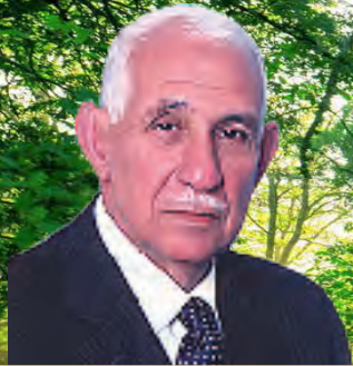
إعداد : عبد الرحيم ابن جلون