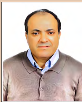
par Docteur Ali ID HAMMOU

Chez certaines personnes les cellules de la surrénale se dérèglent et libèrent des hormones en quantité exagérée; cela mène à une