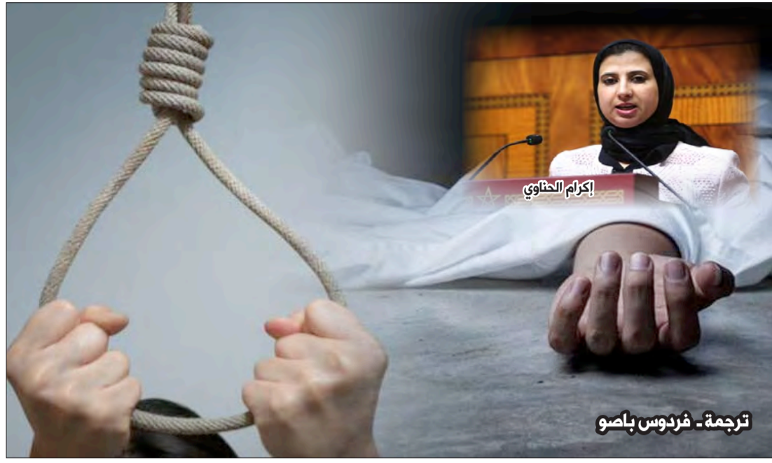
ترجمة - فردوس بلصو

الماضي. وتعلقت آخر حالة انتحار برجل في الأربعينيات من عمره.