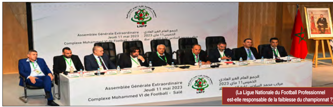
(La Ligue Nationale du Football Professionnel est-elle responsable de la faiblesse du championnat ?)

Pas de stade, pas de public, pas d'argent, très peu de buts, pas de dirigeants compétents, pas de formation des jeunes, un arbitrage et un VAR dépassé par la variété des nouvelles règles du jeu, une monotonie dans les différentes tactiques du jeu, un béton à l'italienne à la défensive pour garder le 0-0, voici les principales caractéristiques du football national qui n'a que le nom de professionnel mais qui est amateur à cent pour cent. Tout ce qui est sauvegardé consiste à préserver les droits des entraîneurs et des footballeurs avec le respect total des contrats signés sous la peine d'une lourde sanction de la FIFA. Cette saison, toutes les formations jouent à l'étranger. Il est certain que les stades manquent au moment où le pays connaît une série de réaménagement des complexes en préparation à la Coupe d'Afrique CAN et à la Coupe du monde. Le championnat présente un panorama