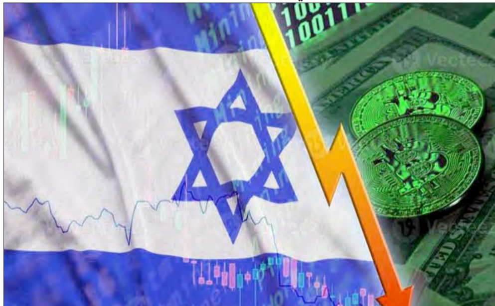
خبراء: إسرائيل تخفي خسائرها واستمرار انهيار اقتصادها بسبب الحرب في غزة

في بداية الحرب على غزة خالفت صحيفة «يديعوت أحرنوت» هذه السياسة، ونشرت تقريراً صادماً عن خسائر جيش الاحتلال وقالت فيه أن عدد الجنود الجرحى بلغ نحو 5 آلاف من بينهم