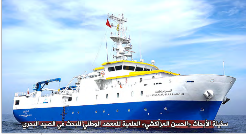
سفينة الأبحاث «الحسن المراكشي» العلمية للمعهد الوطني للبحوث في الصيد البحري

وتتقترح المبادرة مجموعة من الحلول ذات الأولوية التي تستهدف التكيف والمساهمة في التخفيف من آثار تغير المناخ، من أجل دعم نشوء نظم للمراقبة الساحلية وإدماجها في النظم