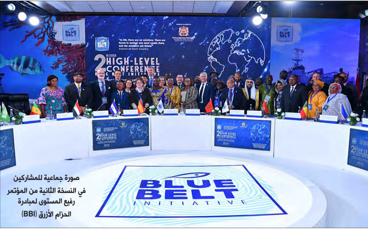
صورة جماعية للمشاركين في النسخة الثانية من المؤتمر رفع المستوى لمبادرة الحزام الأزرق (BBI)

ويذكر أن مدينة أكادير بالمغرب شهدت المؤتمر الثاني الرفيع المستوى ل «مبادرة الحزام الأزرق» في يناير 2023 تحت شعار: «من أجل الأدمج العلمي، والاقتصادي والبيئي لفائدة الاقتصاد الأزرق» وكان يهدف إلى تقديم أمثلة عن المشاريع المستدامة الموجهة نحو الأعمال التجارية.