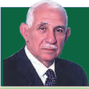
إعداد : عبد الرحيم بن جلون