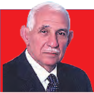
إعداد : عبد الرحيم بن جلون