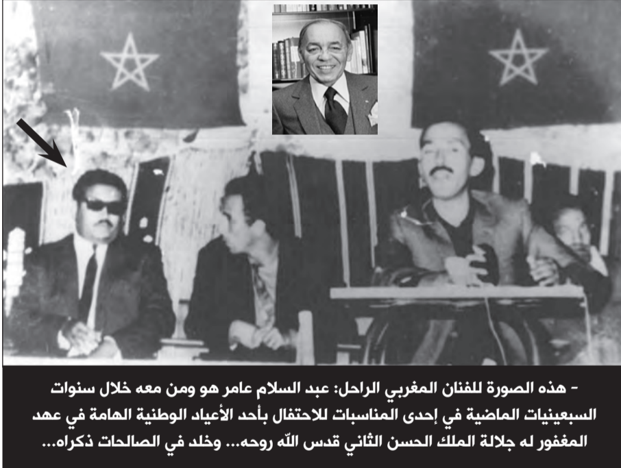
- هذه الصورة للفنان المغربي الراحل: عبد السلام عامر هو ومن معه خلال سنوات السبعينيات الماضية في إحدى المناسبات للاحتفال بأحد الأعياد الوطنية الهامة في عهد المغفور له جلالة الملك الحسن الثاني قدس الله روحه... وخلد في الصالحات ذكره...

غير أن الموسيقار عبد السلام عامر استطاع بحسه المرهف وبحثه الرصين الوصول إلى شاعر موهوب رقيق الشعور والإحساس هو الأستاذ الجليل عبد الرفيع جواهري الذي اخترق مع عامر الحدود والأفاق بالكلمة واللحن والأداء، بأعمال وستظل في مجملها باقة ورد تسحر العقول والقلوب.