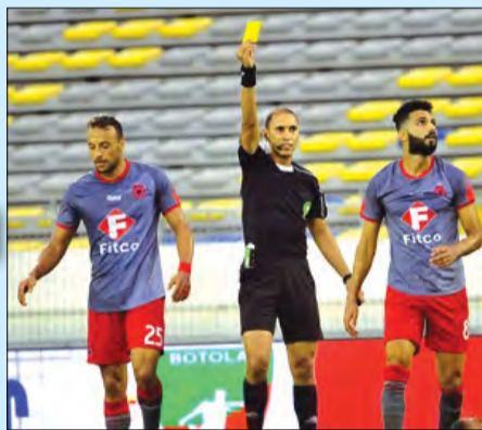
Un carton jaune pour le football marocain

LA MOITIÉ DES CLUBS DE LA LIGUE PROFESSIONNELLE MAROCAINE EST EN SITUATION ILLÉGALE