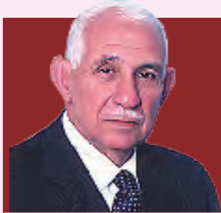
إعداد : عبد الرحيم ابن جلون