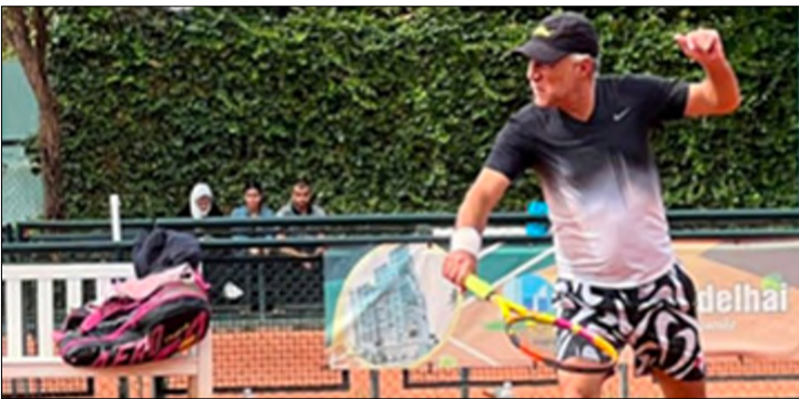
En haut : Les Membres des deux clubs organisateurs du tournoi : TCMT et Rotary