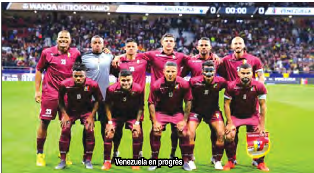
Venezuela en progrès