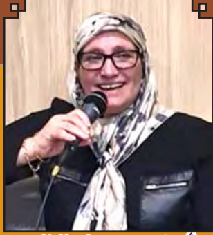
تأليف: د. سعاد الناصر